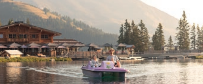
Erlebnispark Hög. Serfaus.